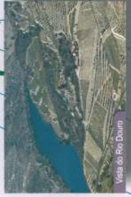
Visão do Rio Douro