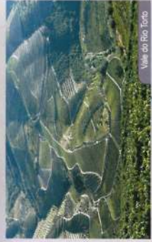
Visão do Rio Torgo

NaturVeredas Paisagem, natureza, recreio, saúde e educação 4540-011 São João da Pesqueira Tel: 255 94 1854 Fax: 255 94 3171 - 983 09 270 www.naturveredas@apo.pt