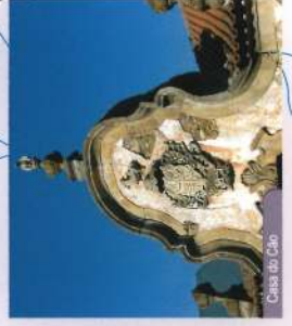
Casa do Cão

Passada a Quinta do Monte Bravo, agora por uma estreita estrada asfaltada, continua-se até Ervedosa onde se entra pela rua da Portagem, em direção à distinta Casa do Cão, chegando novamente à Sede de Junta.