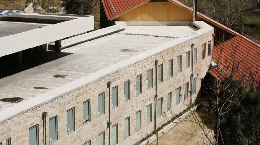
Centro de Documentação/Arquivo-Histórico · Documentation Centre/Archive

O Centro de Documentação/Arquivo-Histórico do Museu de Lanifícios da UBI foi criado em 1997, no âmbito do projecto comunitário ARQUEOTEX (FEDER 10, Vertente Cultura), e inaugurado em 30 de Abril de 1998. Desde 2004, encontra-se instalado no Núcleo da Real Fábrica Veiga/Centro de Interpretação dos Lanifícios, que integra simultaneamente a Sede do Museu de Lanifícios e o Núcleo Museológico da Industrialização dos Lanifícios.